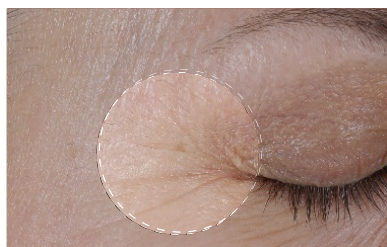
Après (gros plan)