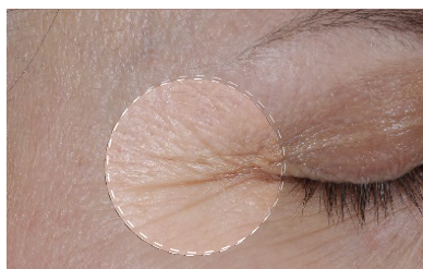
Avant (gros plan)

Phyto-Nature Firming Serum vous redonne les années que votre exposome vous enlève.